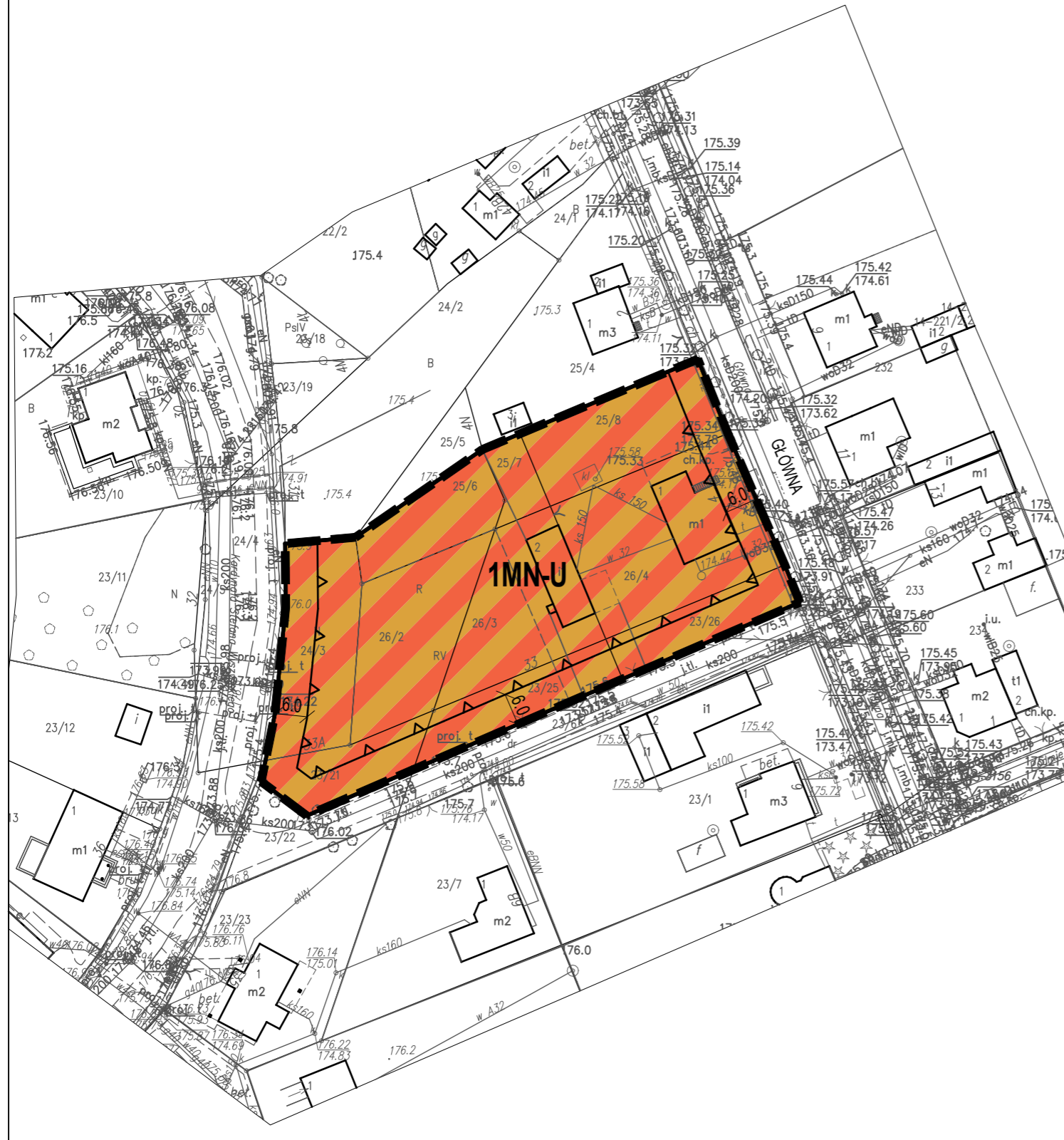
Wrys ze Zmiany Studium uwarunkowań i kierunków zagospodarowania przestrzennego Miasta Zduńska Wola przyjętego uchwałą Rady Miasta Zduńska Wola Nr X/199/19 z dnia 27 czerwca 2019r. skala: 1 10 000