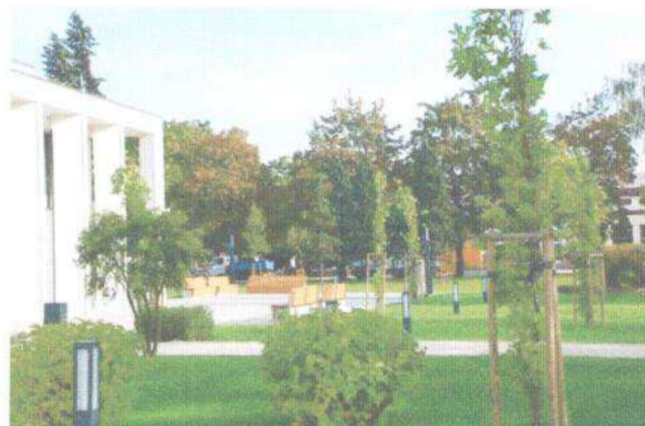
Park przy Placu Wolności, 2014 r.