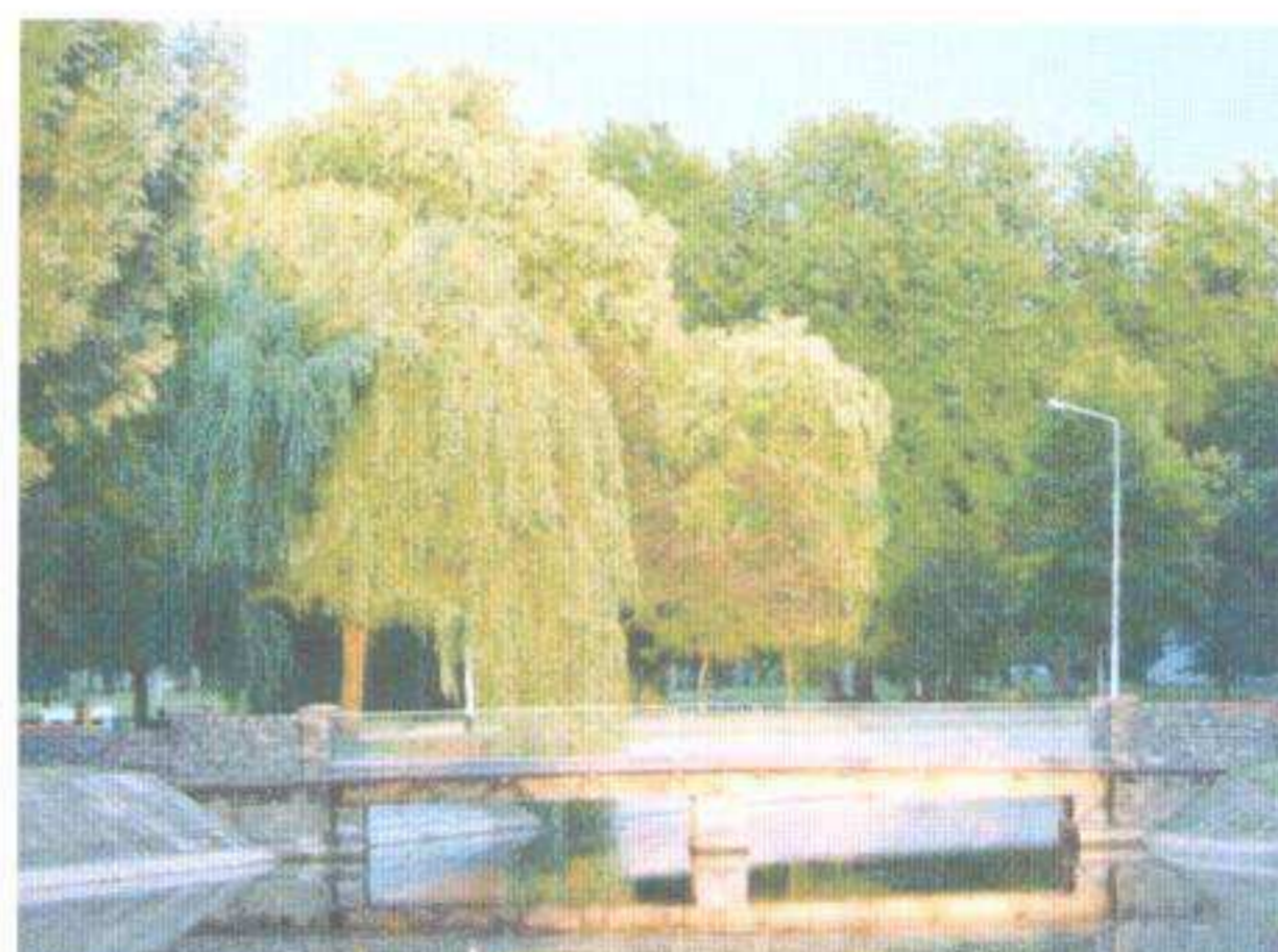
Park miejski – stan obecny.