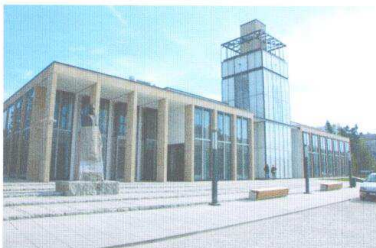
Ratusz – Zduńskowolskie Centrum Integracji, 2014 r.