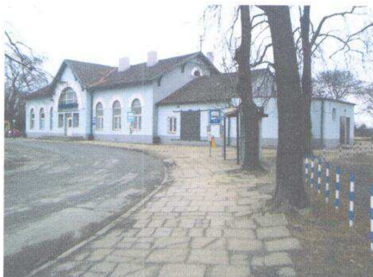
Dworzec kolejowy – stan obecny.

– ogłoszenie konkursu na opracowanie koncepcji architektoniczno – budowlanej rozbudowy budynku dworca kolejowego wraz z zagospodarowaniem przyległych terenów przestrzeni publicznej,