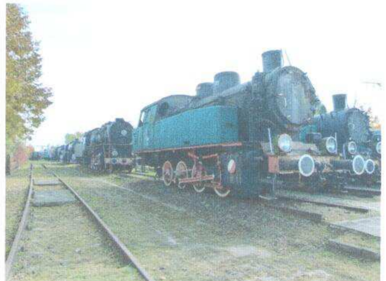
Skansen Lokomotyw – stan obecny.

jak również prywatne plany inwestycyjne polegające na adaptacji bądź przebudowie obiektów pofabrycznych, m.in. odkrycie zabytkowej cegły budynków wchodzących w skład zespołu browaru przy ul. Parkowej, adaptacja budynku dawnej fabryki przy ul. Fabrycznej na tzw. lofty.