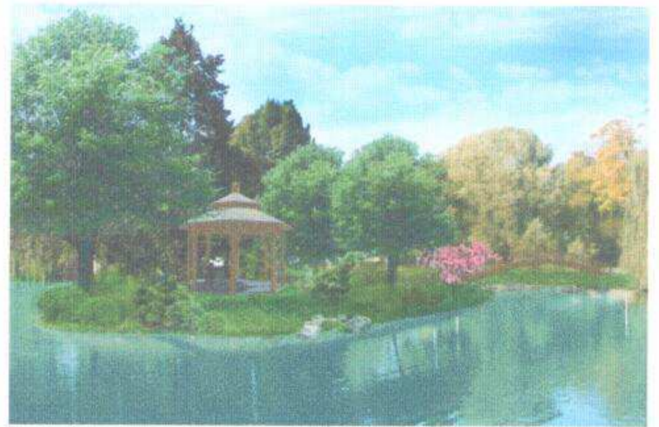
Koncepcja zagospodarowania parku miejskiego.

– zamierzenia dotyczące zagospodarowania terenu Skansenu Lokomotyw i Urzędzeń Technicznych w Karsznicach wraz z renowacją tamtejszych eksponatów,