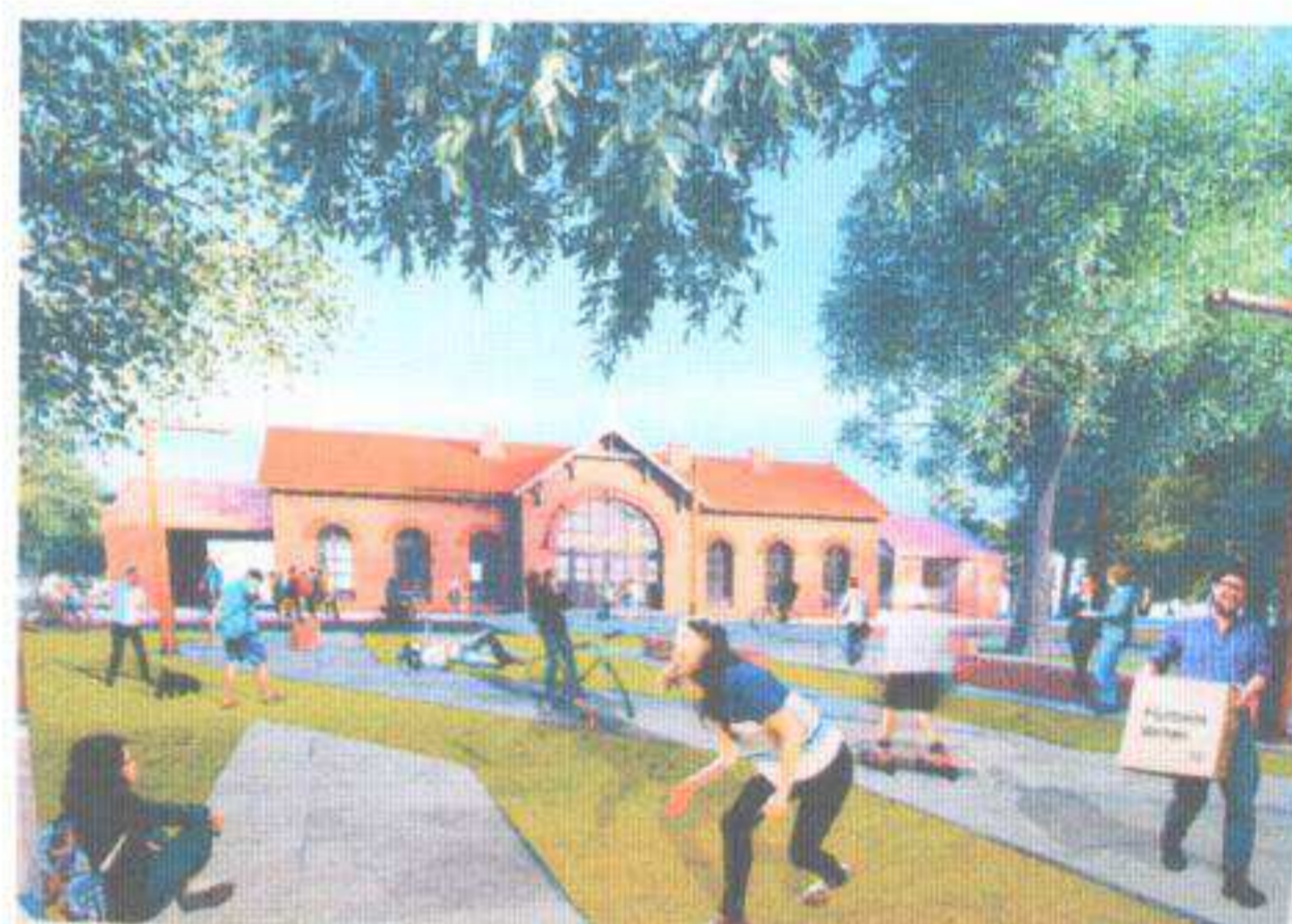
Koncepcja rozbudowy dworca kolejowego wraz z zagospodarowaniem przyległych terenów przestrzeni publicznej.

– projekt rewaloryzacji parku miejskiego wraz z koncepcją jego zagospodarowania,