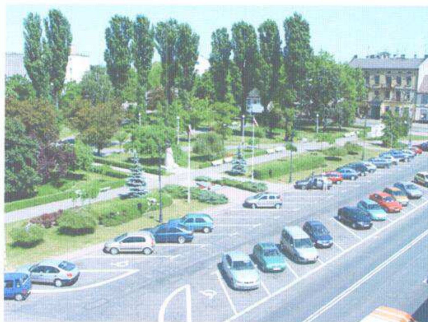
Plac Wolności przed rewitalizacją, 2011 r.

– rewitalizację centrum miasta, w ramach której wybudowano Ratusz – Zduńskowolskie Centrum Integracji, zagospodarowano tereny zieleni przy Placu Wolności oraz wyremontowano kamienice wraz z podwórzami,