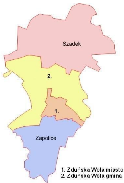
Rysunek 1. Miasto Zduńska Wola w powiecie zduńskowolskim

Zduńska Wola, miasto w województwie łódzkim, siedziba starostwa powiatu zduńskowolskiego i Urzędu Gminy Zduńska Wola. Położone jest na Wysoczyźnie Łaskiej, na obszarze prawie równinnym, nad rzeką Pichną, prawym dopływem Warty. Zduńska Wola zajmuje obszar 24,58 km 2 . Według danych GUS z końca 2020 roku Miasto liczy 41.288 mieszkańców, a gęstość zaludnienia to w przybliżeniu 1696 os./km 2