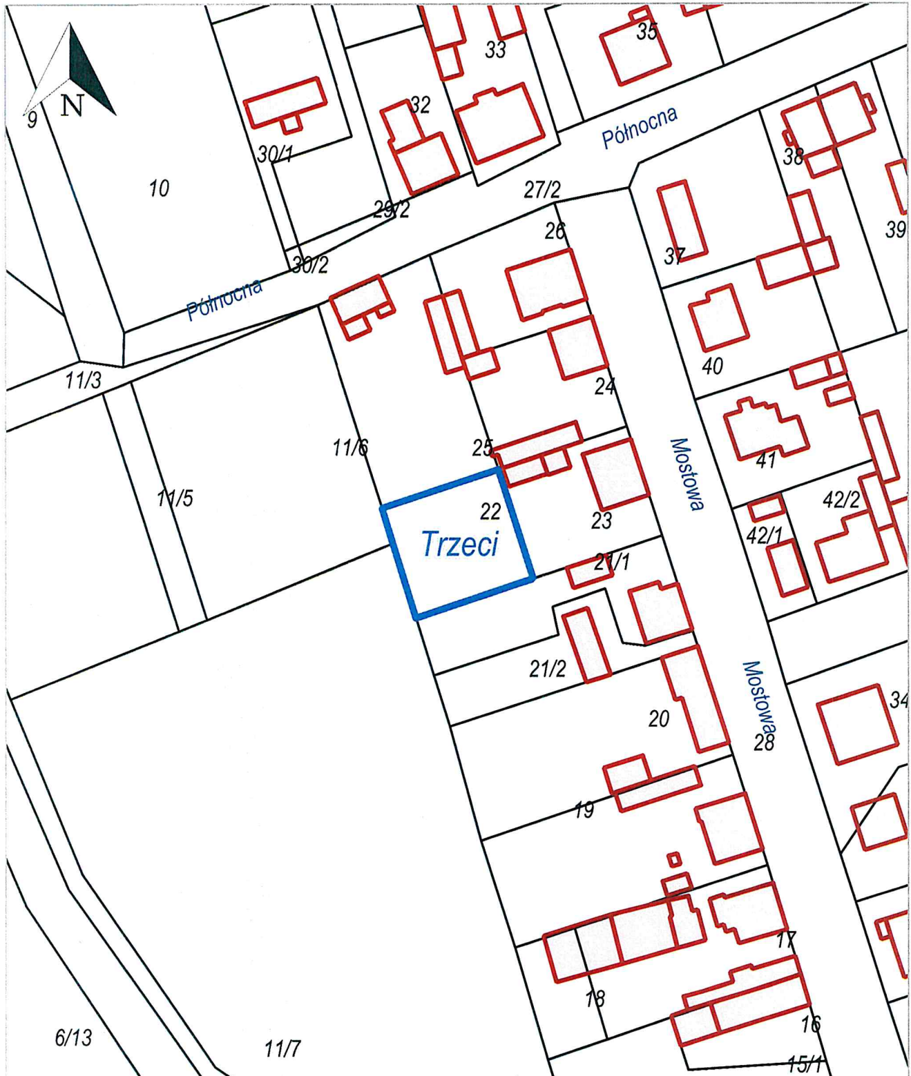
Trzeci, Zduńska Wola - miasto