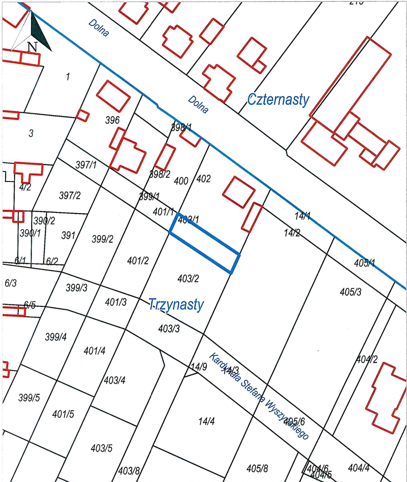
Trzynasty, Zduńska Wola - miasto | Czternasty, Zduńska Wola - miasto