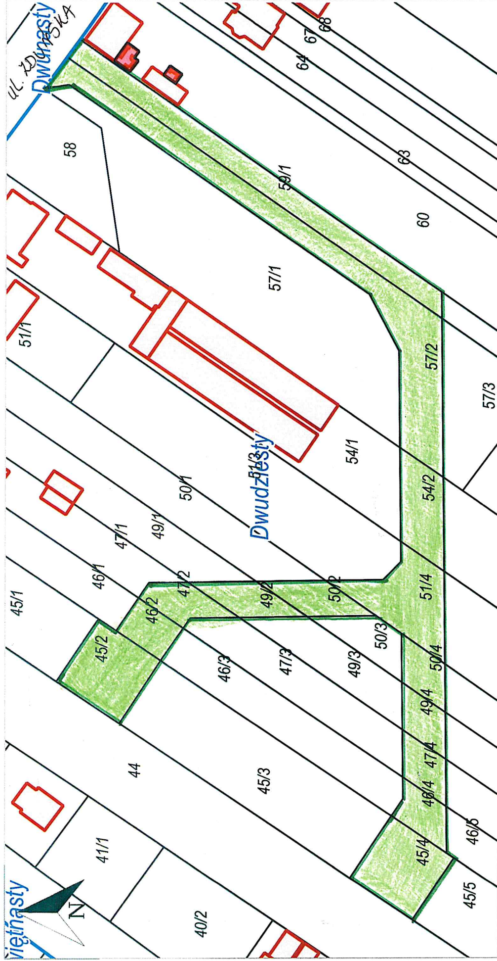
Dwudziesty, Zduńska Wola - miasto | Dzierwiężnasty, Zduńska Wola - miasto | Dwudziesty, Zduńska Wola - miasto